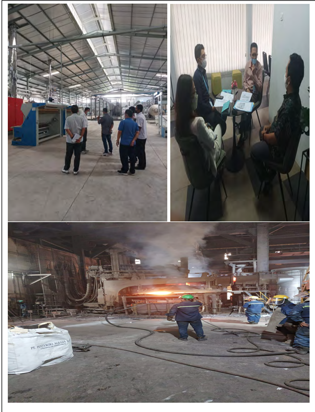
Gambar 4. Dokumentasi Indikator Kinerja Peningkatan peran Balai dalam pengembangan industri