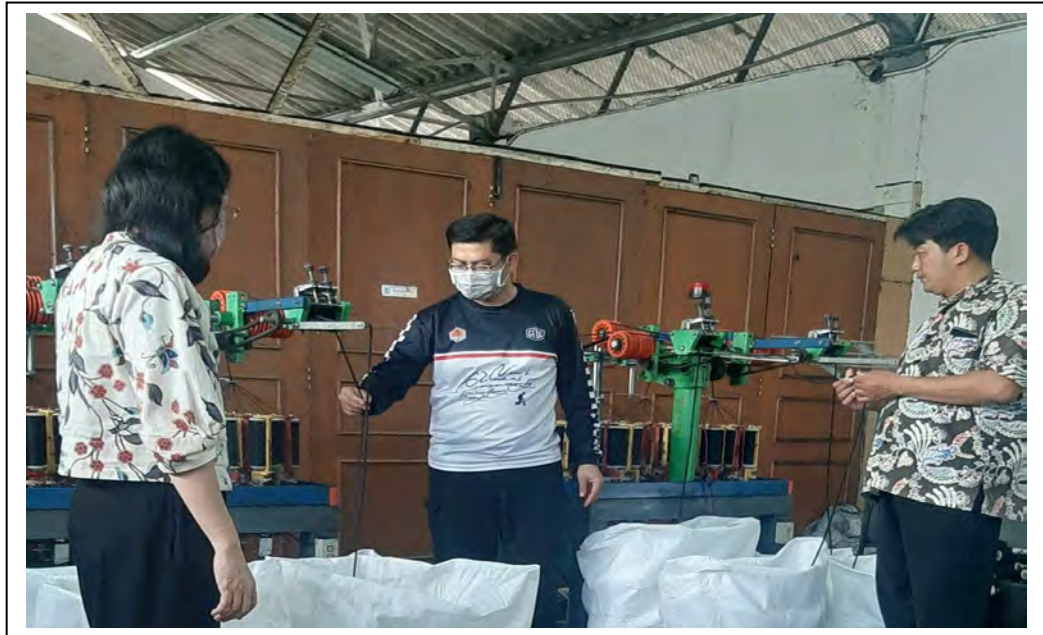
Gambar 2. Dokumentasi Indikator Kinerja Jumlah tenan inkubator berbasis teknologi yang terbentuk