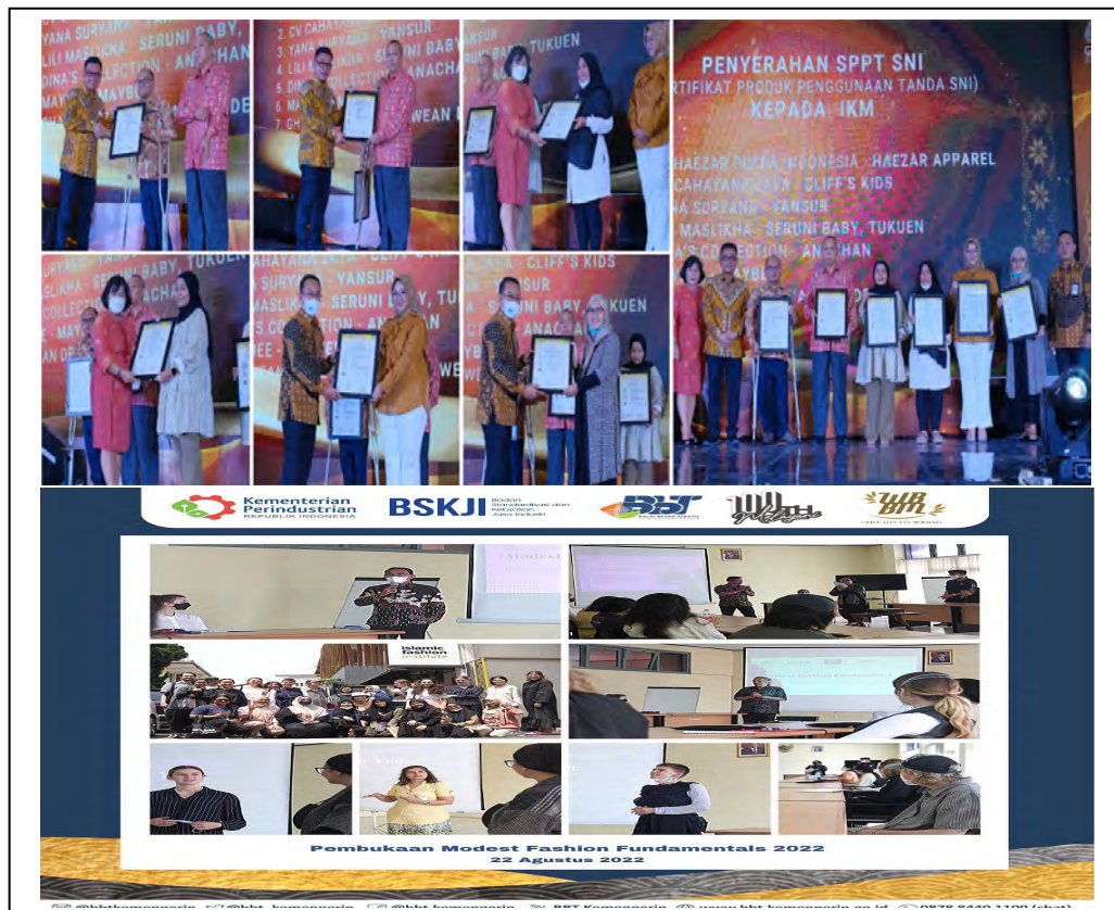
Gambar 3. Dokumentasi Indikator Kinerja Peningkatan kapabilitas hasil kolaborasi dalam rangka pengembangan industri

Rencana perbaikan di Triwulan selanjutnya adalah segera melakukan penyusunan SPK terkait kegiatan kolaborasi lainnya yang akan segera dilakukan pada Triwulan IV.