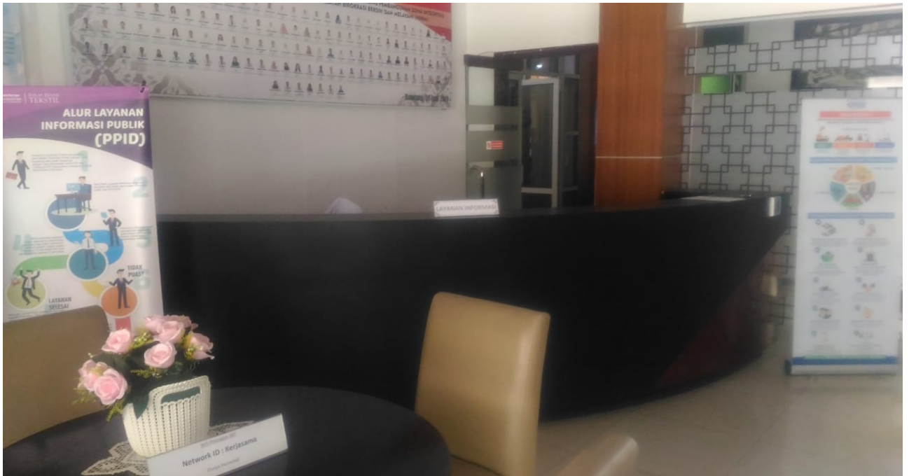
Gambar 1 Meja Layanan Informasi dan Banner SOP PPID Pada Lobby Utama BBT

Fasilitas dalam pelayanan informasi public dapat dilihat pada gambar-gambar berikut ini.