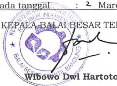
Wibowo Dwi Hartoto